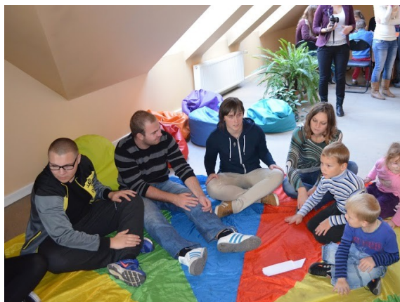
Společná práce s handicapovanými dětmi v Liepaje