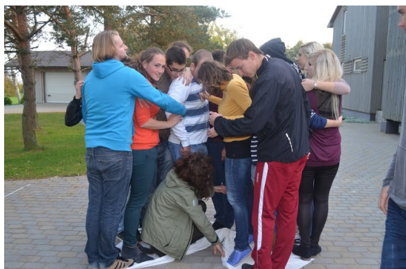
"Musíme se otočit tu plachtu, na které společně stojíme" Jedna z teambuildingových aktivit