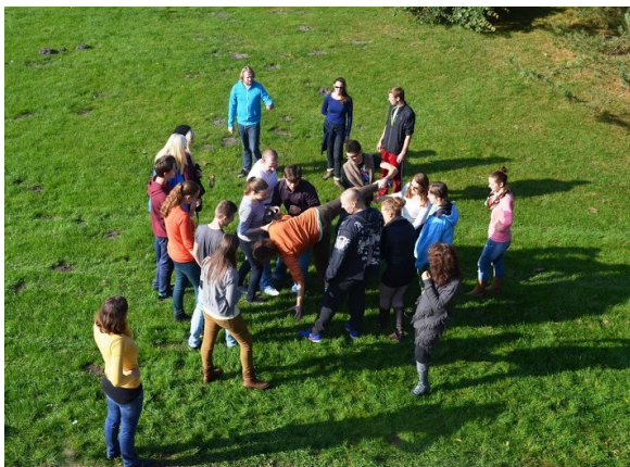
"Jsme jeden tým". Společné řešení zadaného úkolu. Jedna z teambuildingových aktivit