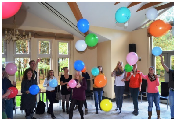
Balónek symbolizuje každého z nás, zpodobnění každého na něm je dílem hned několika dalších lidí