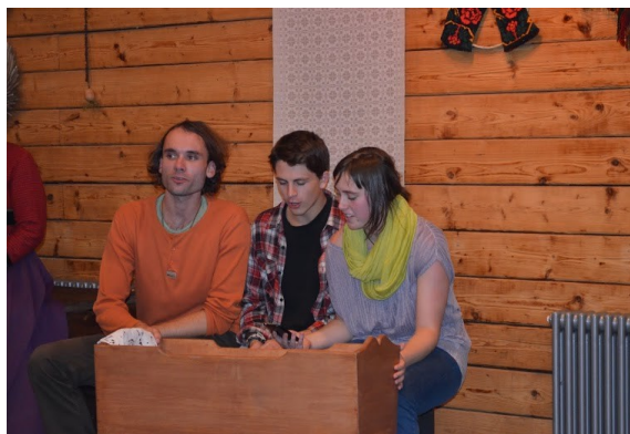
Česká skupina při zpěvu ukolébavky během lotyšského národního večera v nejstarší stavbě v Liepaji