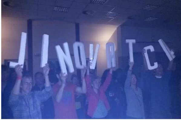
Fanoušci kapely Jinovatka