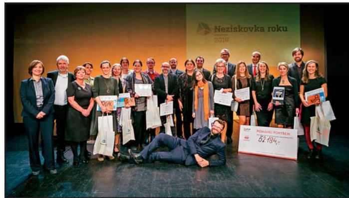
Fotografie ze slavnostního vyhlášení Neziskovka roku 2016, které se konalo 28. 11. 2016 v pražském divadle Archa.