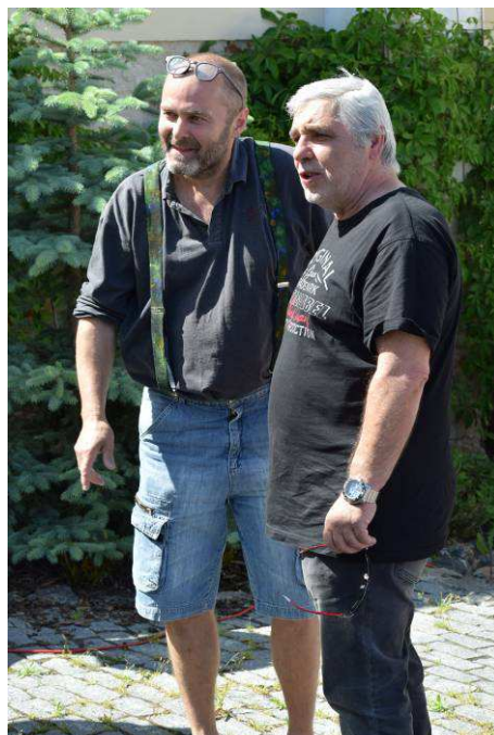
Fíďa byl při vernisáži na roztrhání...