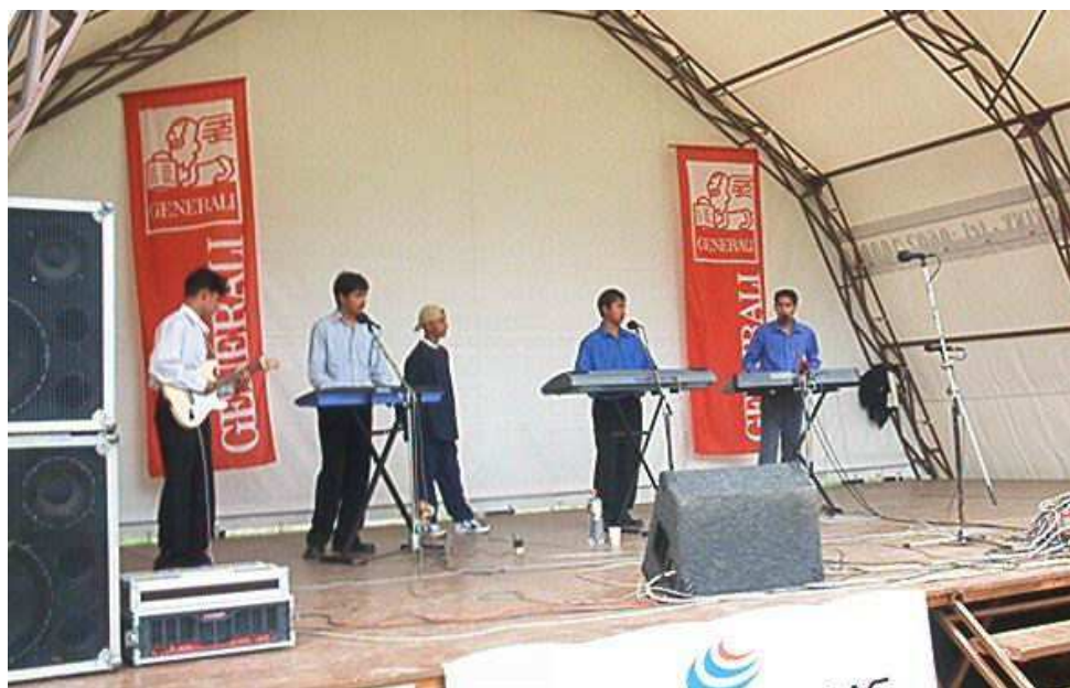
Bambiriáda 2003 České Budějovice. Vystoupení mladé rómské kapely z našeho klubu Bouda

Prezentace neziskových organizací Jihočeského kraje, které pracují s dětmi a mládeží. CPDM, o.p.s. – ICM Český Krumlov zajišťovalo na této celokrajské akci ve spolupráci s dalšími jihočeskými ICM (Tábor, České Budějovice) volnočasovou expozici v rámci informačního projektu „Češi a Evropa“ s doprovodnými soutěžemi pro děti a mládež a také tiskové mediální centrum celé jihočeské Bambiriády. (viz aktivity ICM Český Krumlov). V rámci pódiových vystoupení přivezlo CPDM, o.p.s. do Českých Budějovic rómskou kapelu „Jilestar“ z Boudy.