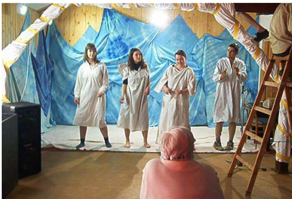
Divadelní představení v klubu Bouda