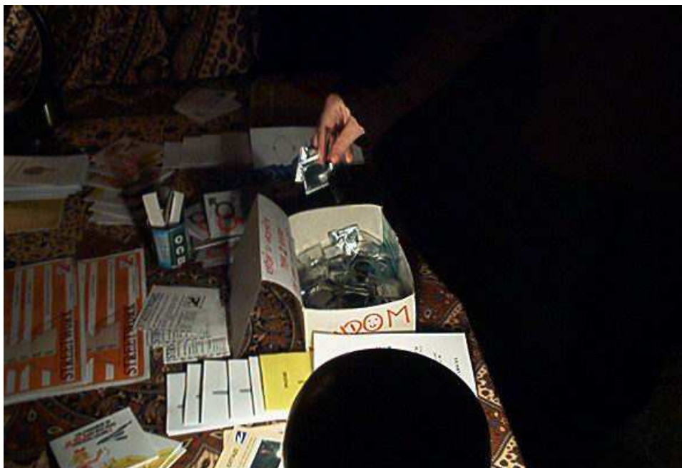
„Káčkaři“ na streetparty