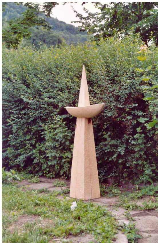
„Děti a sochy 2003“ Jeden z uměleckých výstupů projektu

rozvíjení manuální zručnosti účastníků a spolupodílení na zkrášlení areálu zahrady vlastními díly dětí a mládeže. Projektu se zúčastnilo v průběhu celého týdne celkem kolem 120 dětí z Českého Krumlova.