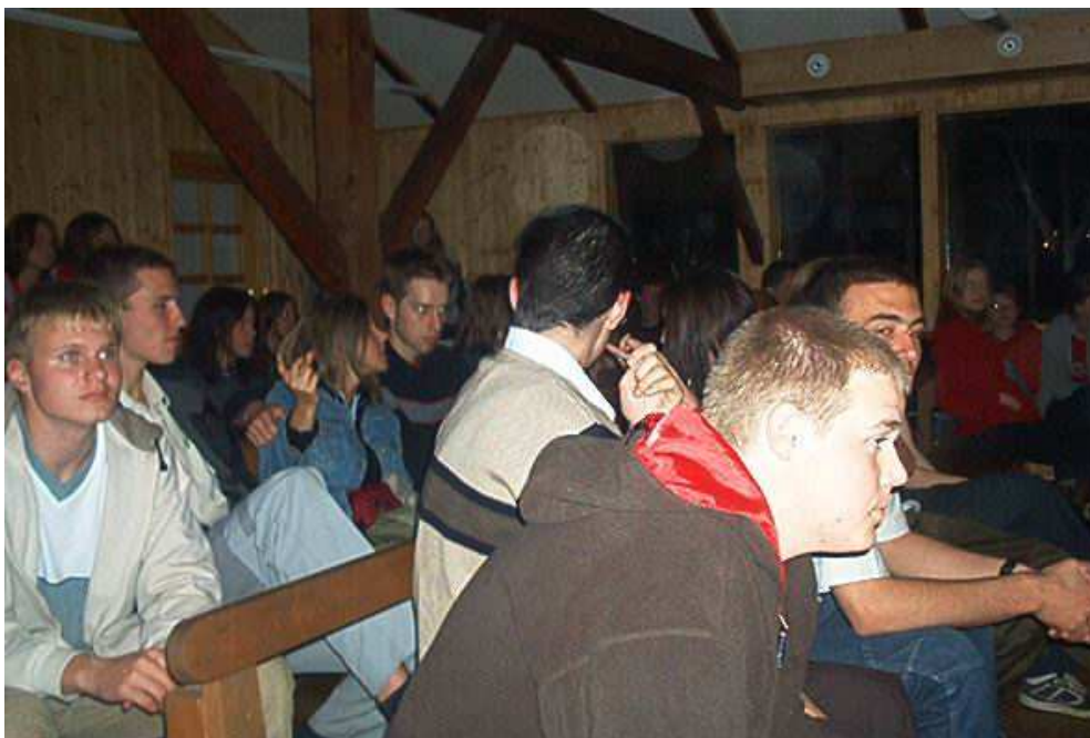
Krumlovští mládežníci na jednom z koncertů v Boudě