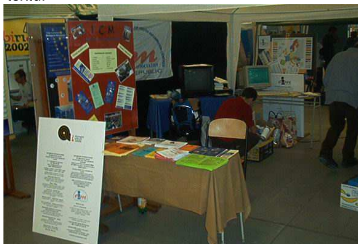
Expozice ICM na veletrhu Regiointour – leden 2003

Další společné informační projekty jihočeských ICM realizované v roce 2003 jsou uvedeny výše v textu.