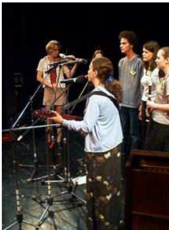
Dětská Porta 2003 Vítězové jedné ze soutěžních kategorií

Tradiční soutěžní přehlídka dětských a mládežnických talentů v oblasti folkové a country hudby s navazujícím folkovým festivalem. CPDM, o.p.s. bylo spolu s DDM Český Krumlov, S.D.M. České Budějovice a městským divadlem, o.p.s. Český Krumlov již tradičním spoluorganizátorem této akce. Této akci se zúčastnilo celkem zhruba kolem 300 soutěžících a diváků.