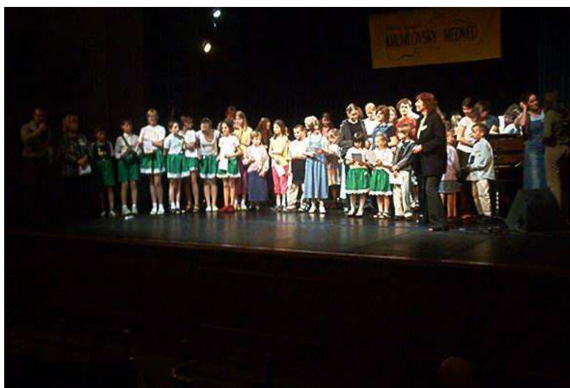
Dětská Porta 2003 Slavnostní ukončení soutěžní přehlídky