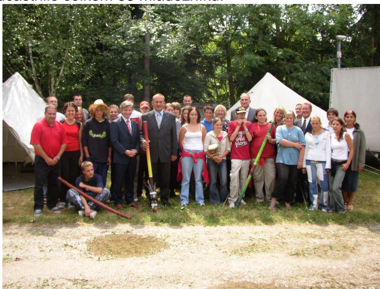
Účastníci evropského projektu „Hudba bez hranic“

Projektu se zúčastnilo celkem 33 mládežníků.